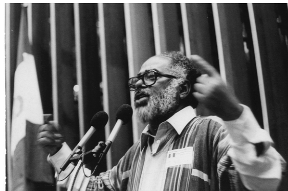
Foi Deputado Federal de 1983 a 1986

De volta do exílio, Abdias estava no histórico 7 de julho de 1978, quando, perante três mil pessoas, foi lançado, nas escadarias do Teatro Municipal de São Paulo, o Movimento Negro Unificado Contra a Discriminação Racial (MNUCDR), com um manifesto que afirmava: "O MNUCDR foi criado para ser um instrumento de luta da comunidade negra".