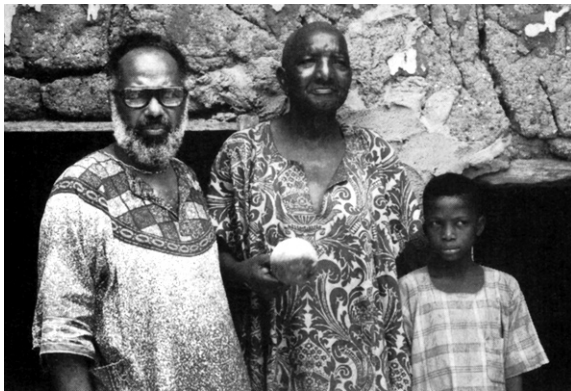
Em uma de suas viagens à África - Nigéria, 1976

que se abateu sobre milhões de homens e mulheres nascidos livres na África e trazidos à força para serem escravizados no Brasil. No pós-abolição, com deveres, mas sem direitos, o povo negro se reunia em associações comunitárias, entidades recreativas, jornais independentes, irmandades religiosas católicas e terreiros religiosos com matriz africana e essas novas formas de organização contribuíram decisivamente para a reconstrução no país de diversificadas identidades, que reafirmaram valores e acumularam forças na luta contra o racismo, já institucionalizado em toda a sociedade brasileira.